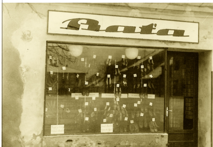
Predajňa Baťa na námestí