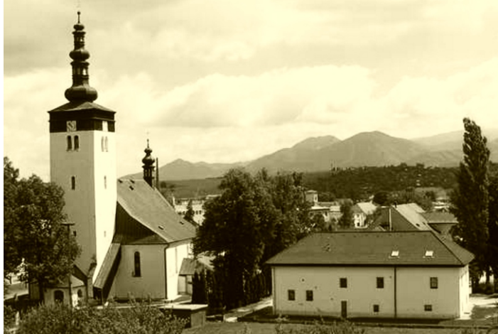
Farský kostol sv. Ladislava

... v Rajci bolo zaužívané spracovanie ľanového semena? Zo semien ľanu sa v prasocho (lisoch) a zábojoch (zariadenia na vytlačenie oleja zo semien) dorábali ľanový olej, ktorý mal výbornú chuť, a aj napriek tomu, že bol dosť drahý, bol veľmi vyhľadávaný. Používal sa na masenie jedál najmä v pôstnom období. Chlieb namáčaný do tohto oleja a mierne posolený bol vynikajúcou pochúťkou. Vylisované ľanové semená, tzv. osúchy sa rozmiešali vo vode a získanou tekutinou sa polievala sečka (porezaná slama) pre dobytok.