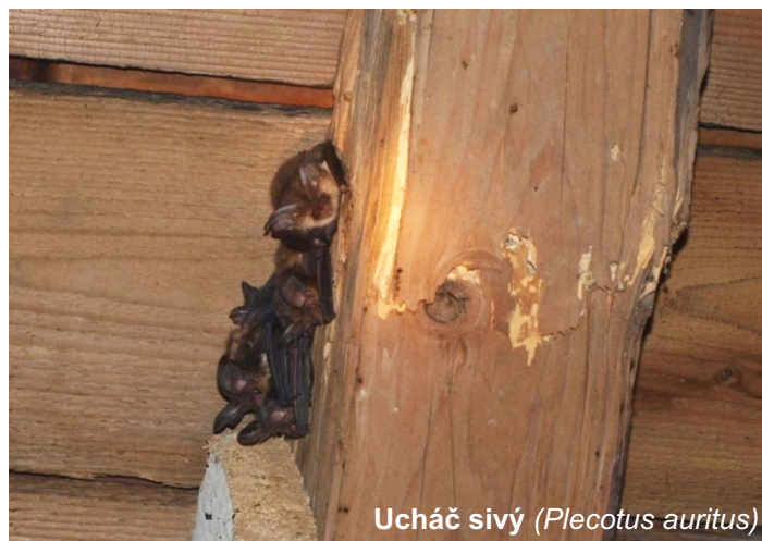
Ucháč sivý ( Plecotus auritus )