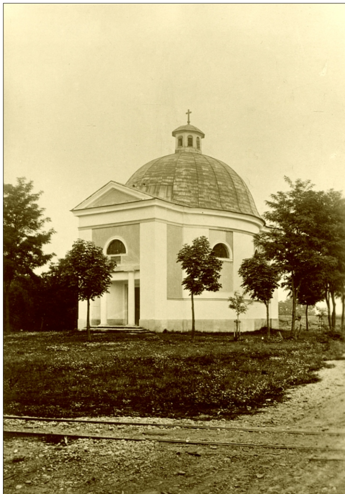
Kostol vo Voderadoch