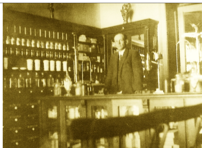
Lekárň Ku zlatému levu pri kostole so svojim lekárnikom (dnešný Domov vďaky)