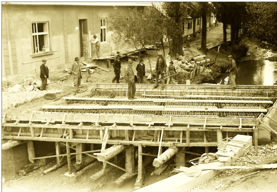
Výstavba mosta na Nádražnej ulici