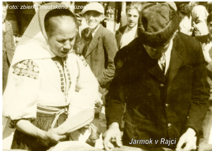
Jarmok v Rajci