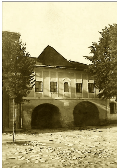
Obecný dom na námestí