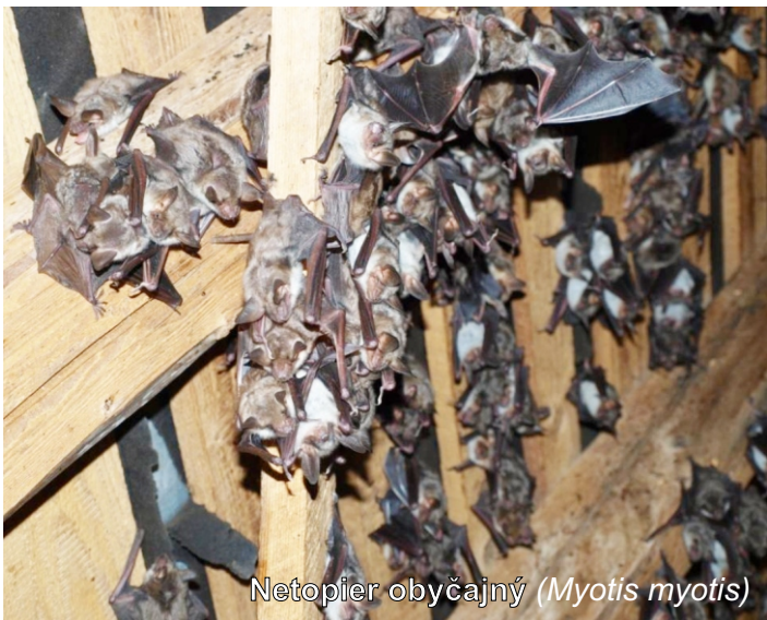
Netopier obyčajný ( Myotis myotis )

V roku 2006 boli skontrolované iba kolónie v kostoloch vo Fačkove, zaznamenaný počet 320 jedincov druhu netopier obyčajný ( Myotis myotis ) a v Rajci kolónia toho istého druhu o veľkosti 580 jedincov.