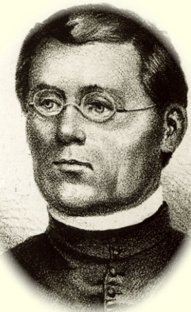
JURAJ SLOTA V SLOVENSKÝCH DEJINÁCH