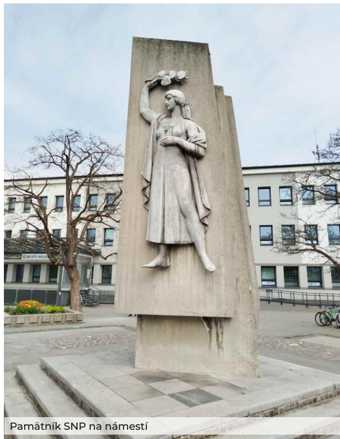
Pamätník SNP na námestí

Na tomto zasadnutí bude tiež prerokované organizačné