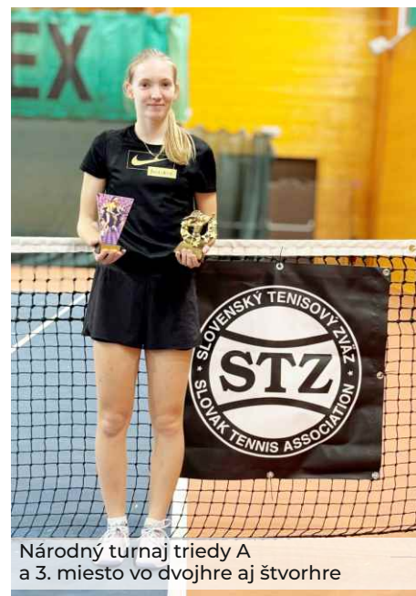
Národný turnaj triedy A a 3. miesto vo dvojhre aj štvorhre