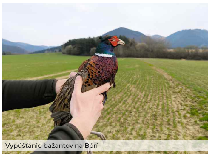
Vypúšťanie bažantov na Bóri

Sadenice sú vypestované v našej lesnej škôlke Elhotná. Po výsadbe sa okolo sadeníc odstraňuje burina výžinom, aby sa zabezpečil ich rast. V jesennom období sú ošetrované náterom proti poškodeniu lesnou zverou. Ročne takto ošetrojeme 40 hektárov mladých lesných porastov. Následne vykonávame prerezávk a z porastov odstraňujeme poškodené a napadnuté stromy.