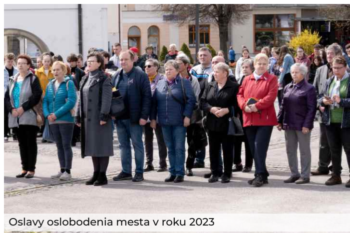
Oslavy oslobodenia mesta v roku 2023

zabezpečenie tematického zájazdu pre členov SZPB, ktorý sa bude konať dňa 9. mája odchodom autobusu z Rajca o siedmej hodine z parkoviska pred Kostolom sv. Ladislava. Zaujímavosťou na tento zájazd sa budú môcť prihlásiť u pokladníčky Mgr. Zadáňančinovej na ČS ZO SZPB, ktorá sa bude konať po skončení spoločenského podujatia 29. apríla vo veľkej zasadačke mestského úradu.