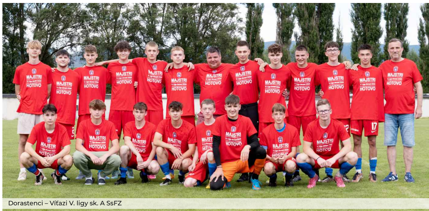
Dorastenci – Víťazi V. ligy sk. A SsFZ