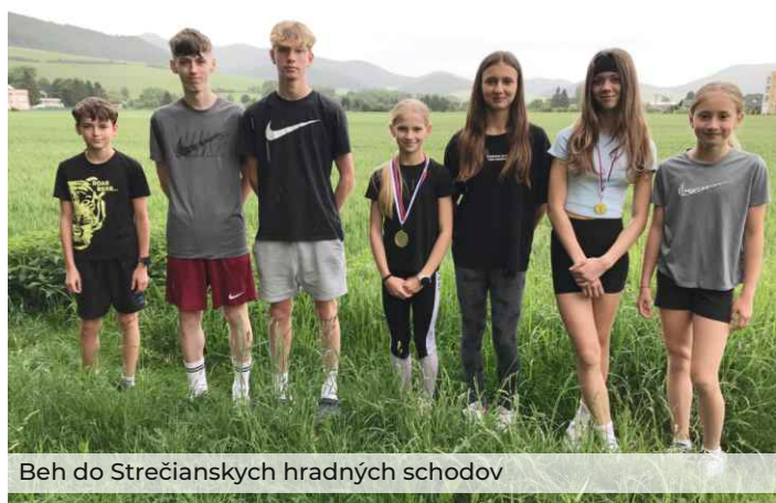
Beh do Strečianskych hradných schodov