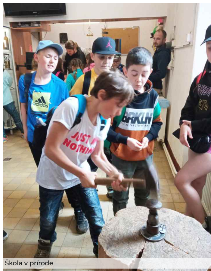
Škola v prírode