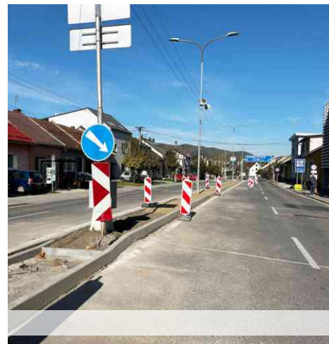
Rekonštrukcia cesty I/64, chodníkov a ostrovčekov na Kostolnej ulici