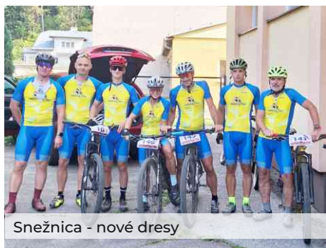
Snežnica - nové dresy