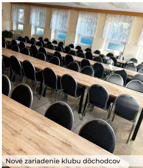
Nové zariadenie klubu dôchodcov