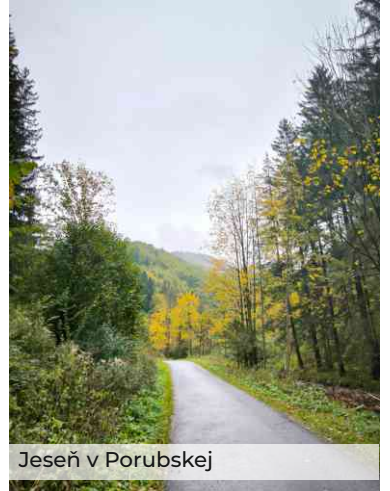
Jeseň v Porubskej