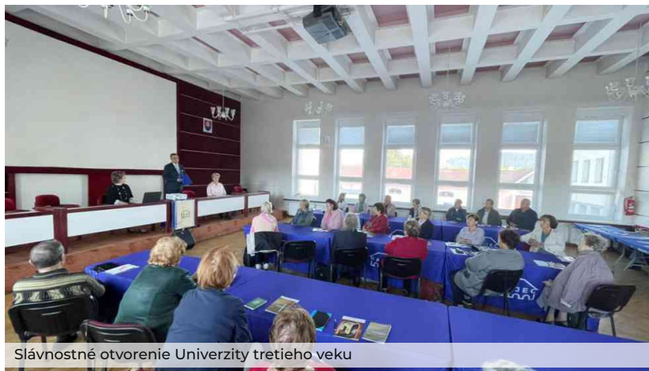
Slávnostné otvorenie Univerzity tretieho veku

riili zvedavosť študentov. Učenie je celoživotný proces a nikdy nie je neskoro naučiť sa niečo nové. Záujem o takéto štúdium prejavilo takmer 50 občanov, čo nás veľmi milo prekvapilo. Tešíme sa, že môžeme byť súčasťou tejto cesty učenia sa a osobného rozvoja v každom veku.