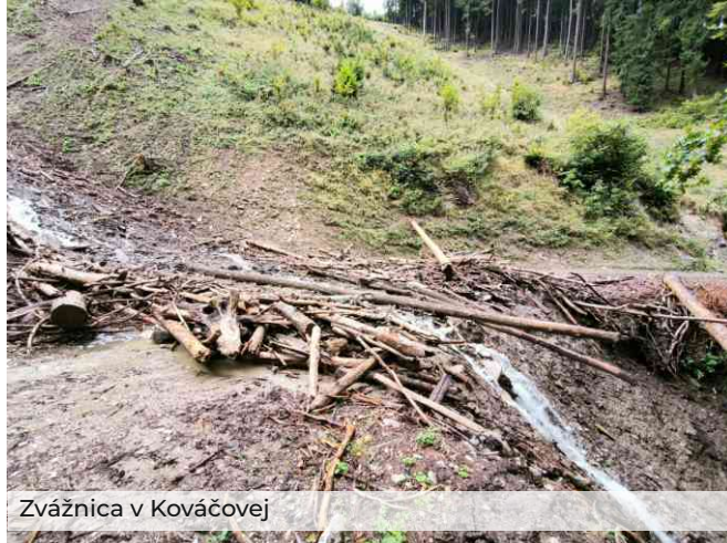
Zvážnica v Kováčovej