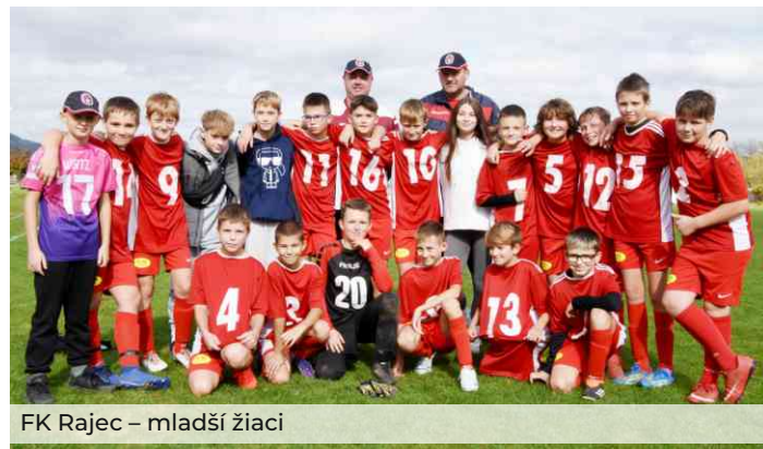
FK Rajec – mladší žiaci

Mladší žiaci tento rok po odchode väčšiny hráčov základu prechádzajú kompletnou obmenou kádra. Nastupujú hráči, ktorí prišli z prípravky a nemajú skoro žiadne skúsenosti, čomu zodpovedajú aj výsledky. Momentálne všetci tréneri mládeže venujú zvýšenú pozornosť týmto deťom, aby sa čo najskôr udomácnili v kádri a začali dosahovať lepšie výsledky. Posledné kolo ukázalo, že sú na dobrej ceste, keď dokázali zvíťaziť 2:0 nad OŠK Baník Stráňavy.