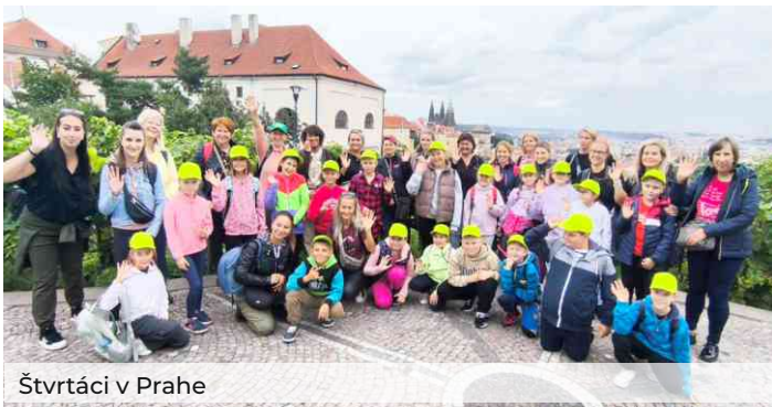
Štvrtáci v Prahe

Nechýbala tradičná účasť na Výstave ovocia, zeleniny a medu. Naši žiaci a kolegovia opäť dokázali, akí sú kreatívni, vynaliezaví